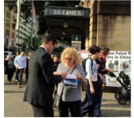
Người dân từ đủ mọi giai tầng ở Sydney đã tham gia ký tên thỉnh nguyện lên án cuộc bức hại Pháp Luân Công

Khi học viên nam biểu diễn bài công pháp tĩnh công thiền định, nhiều người đã chụp ảnh và đặt nhiều câu hỏi. Chồng của cô đã đưa cho họ tờ rơi và nói với họ rằng Pháp Luân Đại Pháp là một hệ thống tu luyện cả tâm lẫn thân. Cặp vợ chồng này hy vọng sẽ lại ghé thăm Bhutan trong năm tới. ■