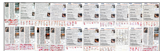
Tháng 06 năm 2014, 590 người ở Trương Gia Khẩu đã ký vào đơn kiến nghị