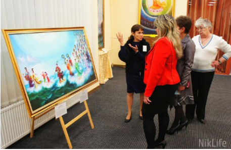
Những hình ảnh trên trang web Niklife