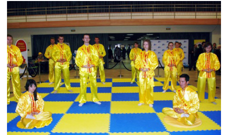
Biểu diễn các bài công pháp

Trong số các quan chức nước ngoài tham dự buổi lễ, có cả Thủ tướng Tony Abbott của Úc và Ngoại trưởng Mỹ John Kerry. Hàng nghìn khán giả đến từ tất cả các tầng lớp trong xã hội đã có mặt đông đúc trên các tuyến phố. ■