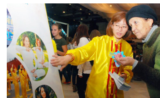
Một học viên nói với người dân sự thật về Pháp Luân Công

Nhiều người đã ký tên thỉnh nguyện để ủng hộ sự phản bức hại ôn hòa của các học viên. ■