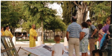
Cư dân địa phương và du khách đọc các biểu ngữ.

[MINH HUỆ 29-06-2014] Các học viên Pháp Luân Công đã tổ chức sự kiện “Ngày thông tin” ở Quảng trường Syntagma thuộc trung tâm Athens, Hy Lạp vào ngày 18 tháng 06. Các bài công pháp nhẹ nhàng đã thu hút sự chú ý của cư dân địa phương cũng như các du khách, nhiều người trong số họ sau đó đã tìm hiểu về cuộc đàn áp Pháp Luân Công ở Trung Quốc.