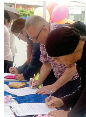
Mọi người xếp hàng để chờ ký tên vào đơn thỉnh nguyện tại Lễ hội Văn Hoá Frankfurt.