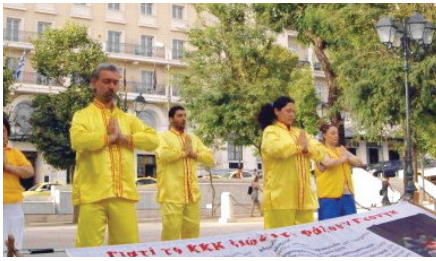
Biểu diễn các bài công pháp.