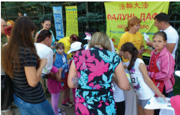
Các em nhỏ học cách gấp hoa sen giấy, trong khi cha mẹ của các em đọc thông tin về Pháp Luân Công.

Bài viết của phóng viên báo Minh Huệ ở Nga