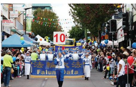
Đoàn Pháp Luân Công trong cuộc diễu hành.