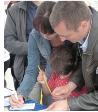
Cả gia đình ký tên thỉnh nguyện.

Một cô gái trẻ đã rất ấn tượng với những bông sen giấy tuyệt đẹp được trưng bày trên bàn. Cha của cô cho biết