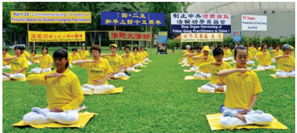
Luyện công tập thể ở Singapore để kỷ niệm cuộc thỉnh nguyện ngày 25 tháng 4

Tội ác đã khiến nhiều người cảm thấy sốc, gồm cả người dân địa phương, du khách, học sinh và những người từ Ấn Độ, Australia, Anh, Mỹ, Trung Quốc, Serbia, Nga, Cộng hòa Síp, Philippine, Hà Lan... sang Singapore công