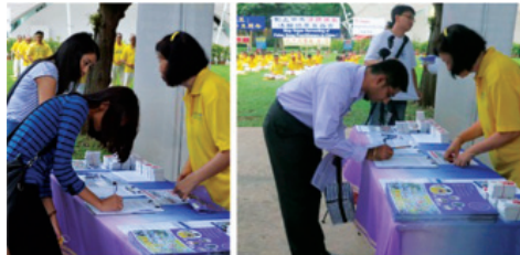
Khách qua đường tìm hiểu về Pháp Luân Công và ký thỉnh nguyện lên án tội ác thu hoạch nội tạng từ các học viên Pháp Luân Công còn sống của Đảng Cộng sản Trung Quốc (ĐCSTQ)