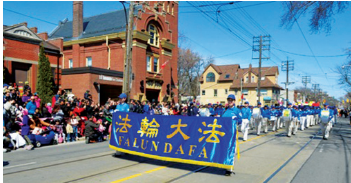
Thiên Quốc Nhạc Đoàn Toronto tại cuộc diễu hành mừng lễ Phục Sinh

BÀI VIẾT CỦA TRƯƠNG VẬN, PHÓNG VIÊN BÁO MINH HUỆ Ở TORONTO, CANADA