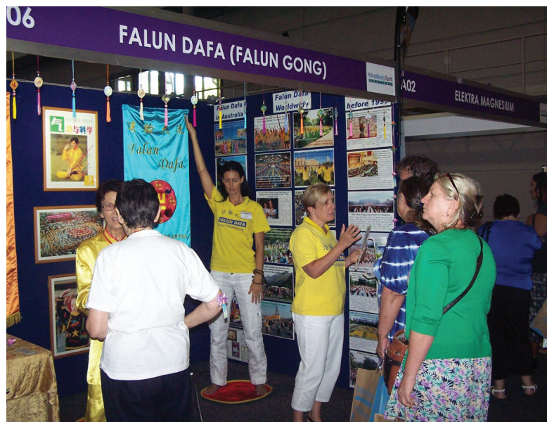
Khách tham quan tìm hiểu về Pháp Luân Công tại Lễ hội Tinh thần – Thể chất – Tâm linh ở Brisbane, Úc.

Cô nói rằng cô vẫn không thể hiểu được tại sao sự vi phạm nhân quyền ghê tởm như vậy có thể xảy ra trong một xã hội hiện đại. Cô và các bạn cô cho biết họ sẽ cố gắng luyện công khi trở về nhà. ◇