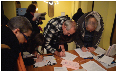
Khán giả ký tên vào đơn thỉnh nguyện lên án hành động mở cướp nội tạng của ĐCSTQ.

Nhiều khán giả cảm thấy thật khó tin khi biết được rằng những người tu luyện theo các nguyên lý của Chân – Thiện – Nhẫn lại bị đàn áp ở Trung Quốc.