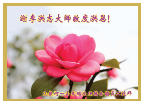
Một thiệp chúc mừng từ một tổng giám đốc cùng với toàn thể nhân viên của một doanh nghiệp tại Khu Bắc Đới Hà, thành phố Tân Hoàng Đảo, tỉnh Hà Bắc

Một số thiệp chúc mừng cho thấy các học viên đã thể hiện vẻ đẹp của Pháp Luân Đại Pháp và thay đổi cách nhìn của người dân Trung Quốc không phải là học viên như thế nào.