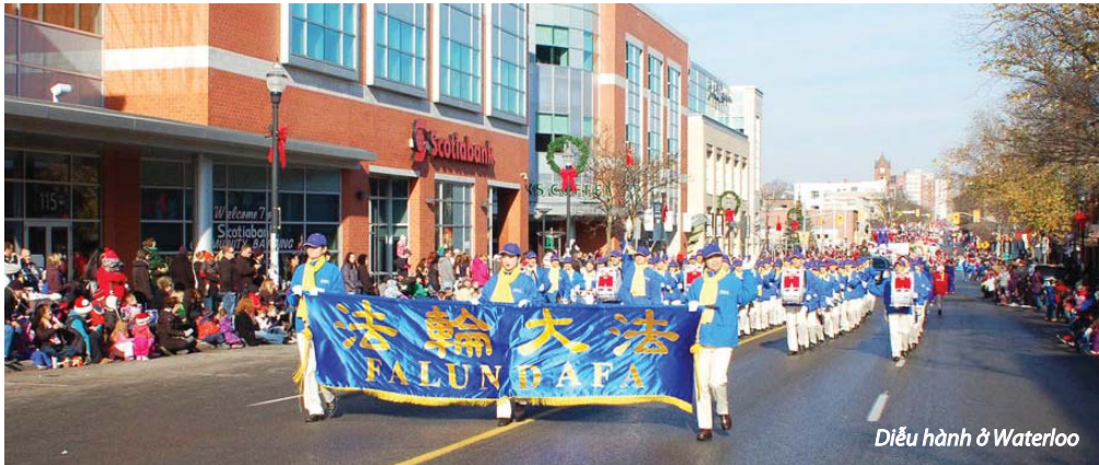
Diễu hành ở Waterloo

[MINH HUỆ] Vào cùng ngày 19 tháng 11 năm 2013, Thiên Quốc Nhạc Đoàn của các học viên Pháp Luân Công Toronto đã trình diễn tại ba lễ diễu hành Giáng sinh trong các lễ hội ở Waterloo, Hamilton và Brampton. Hàng trăm nghìn người đã xem các cuộc diễu hành. Người tổ chức lễ diễu hành ở Waterloo nhận xét: “Họ rất bận rộn vì họ quá nổi tiếng.”