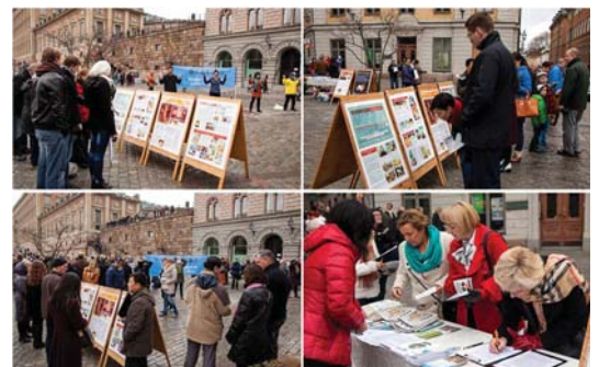
Các học viên phơi bày cuộc bức hại Pháp Luân Công trên Quảng trường Mynttorget ở Stockholm, Thụy Điển

[MINH HUỆ] Vào ngày 09 tháng 11 năm 2013, các học viên Pháp Luân Công ở Thụy Điển đã tổ chức một chiến dịch ký tên trên Quảng trường Mynttorget ở trung tâm thành phố Stockholm. Thỉnh nguyện do Hiệp hội Bác sĩ Chống Mổ cướp Nội tạng Cường bức