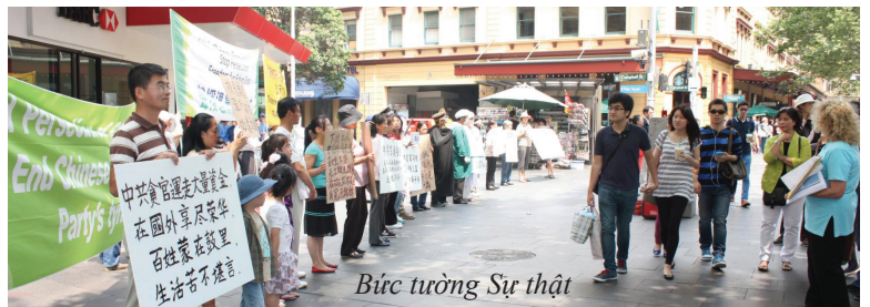
Bức tường Sự thật

Hai chị em người Trung Quốc đã bị hút vào cuộc biểu tình. Một người trong số họ nói rằng họ biết cưỡng bức mô cướp nội tạng đang thực sự xảy ra ở Trung Quốc. Cô của họ là một học viên Pháp Luân Công và vẫn còn đang bị cầm tù ở Bắc Kinh vì tu luyện Pháp Luân Công. Toàn bộ gia đình của họ biết rằng Pháp Luân