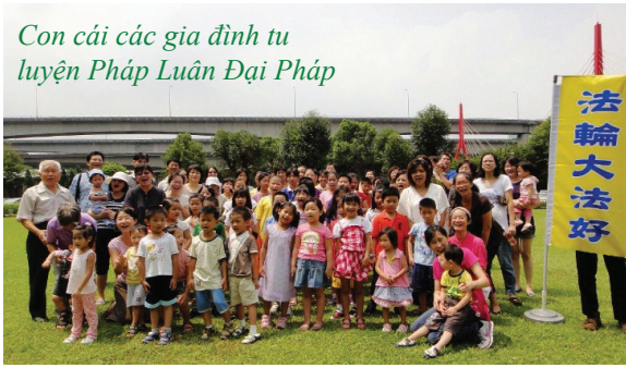
Con cái các gia đình tu luyện Pháp Luân Đại Pháp

với Đại Pháp, Bội Đình nhận biết được đúng và sai rõ hơn so với nhiều trẻ em đồng tuổi.