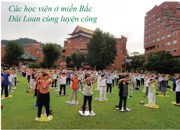
Các học viên ở miền Bắc Đài Loan cùng luyện công

Dục Thừa thường hiểu được điều này, và vì thế không mua những thứ không cần thiết chỉ vì chúng trông độc đáo. Dục Thừa không nghiện xem các chương trình truyền hình như những đứa trẻ khác. Cậu còn nói với bà rằng cậu không thích xem tivi và thích đọc sách hơn. ◇