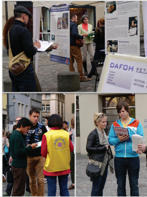
Người qua đường kí tên thỉnh nguyện lên án cuộc bức hại Pháp Luân Công của ĐCSTQ tại Quảng trường Limmatquai và Hirshenplatz, Zurich