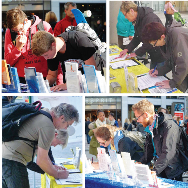
Người qua đường ở Đức ký vào đơn thỉnh nguyện do DAFOH phát động

Các học viên đã đưa cho mỗi ứng cử viên chính trị và trợ lý của họ các tài liệu thông tin và đề nghị họ ký vào đơn thỉnh nguyện.