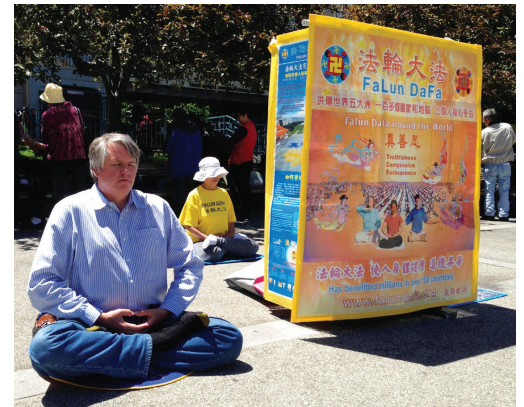
Tình cờ gặp được Pháp Luân Công