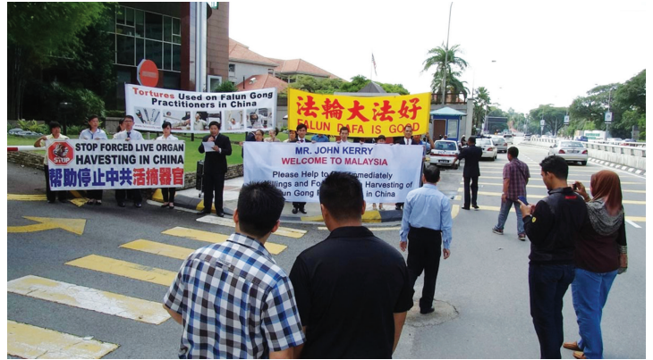
Các học viên Pháp Luân Công tập trung gần Đại sứ quán Mỹ ở Malaysia để kêu gọi chính phủ Mỹ giúp chấm dứt cuộc bức hại Pháp Luân Công của chính quyền Trung Quốc.

[MINH HUỆ 09-10-2013] Trước chuyến thăm Malaysia của Bộ trưởng Ngoại giao Mỹ John Kerry vào tháng 10 năm 2013, các học viên Pháp Luân Công ở Malaysia đã kêu gọi Tổng thống Barack Obama và chính phủ Mỹ tiết lộ các bằng chứng thu thập được năm ngoái về hoạt động cưỡng bức mổ cướp nội tạng của Đảng Cộng sản Trung Quốc (ĐCSTQ), và phá vỡ im lặng về vấn đề này.