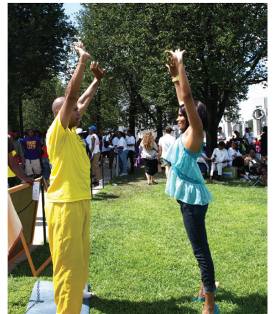
Ảnh: Học các bài công pháp của Pháp Luân Công

Ông nói: “Tôi sẽ không ngừng làm việc để [góp phần] chấm dứt cuộc đàn áp cho đến khi những thủ phạm [của cuộc đàn áp] được đưa ra công lý. ĐCSTQ phải chấm dứt cuộc đàn áp Pháp Luân Công ngay lập tức.”