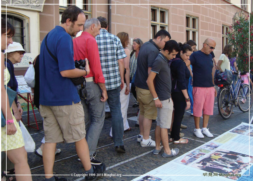
Khách qua đường dừng lại để biết thông tin về nạn cưỡng bức mổ cướp nội tạng

[MINH HUỆ] Các học viên ở Đức đã tổ chức một đợt vận động thu thập chữ ký tại thành phố nghỉ mát nổi tiếng Freiburg vào ngày 17 tháng 08 năm 2013, để kêu gọi chấm dứt tội ác mổ cướp nội tạng từ các học viên Pháp Luân Công còn sống của Đảng cộng sản Trung Quốc (ĐCSTQ) ở Trung Quốc.