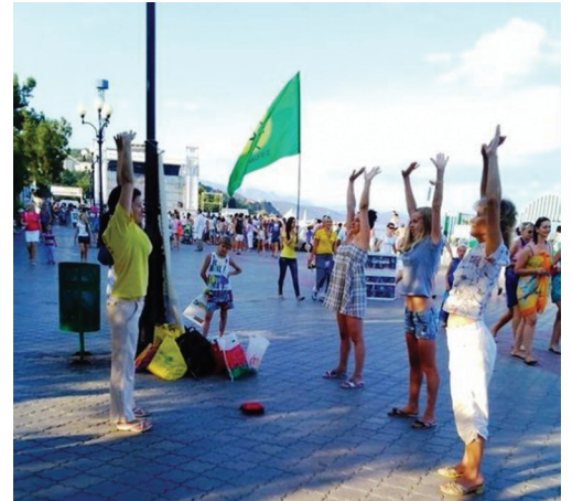
Một số du khách học các bài công pháp