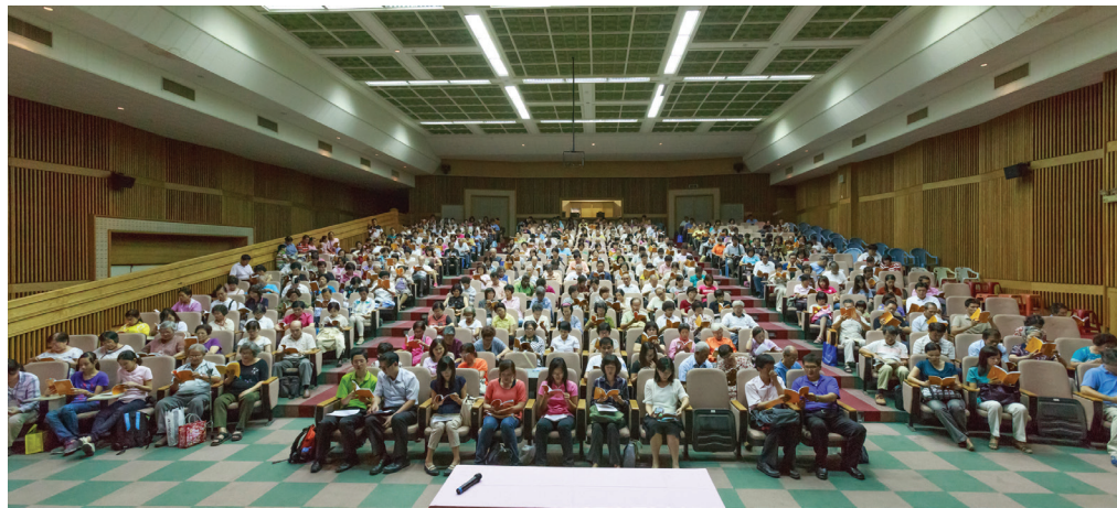
Pháp hội chia sẻ kinh nghiệm của các học viên Pháp Luân Đại Pháp tại Trường Trung học Tiểu Cảng vào ngày 18 tháng 08 năm 2013