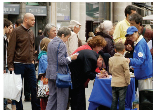
Người dân đợi ký đơn thỉnh nguyện lên án hoạt động mô cớ nội tạng của ĐCSTQ