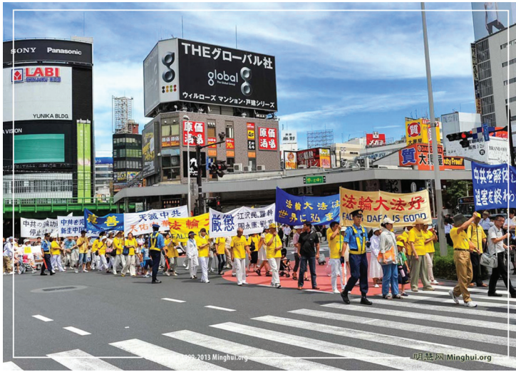
Các học viên ở Nhật Bản diễu hành ở trung tâm Tokyo

[MINH HUỆ] Các học viên Pháp Luân Công ở Nhật Bản đã tổ chức một buổi mít tinh và diễu hành vào ngày 15 tháng 07 năm 2013 ở khu thương mại trung tâm Shinjuku, Tokyo. Họ kêu gọi người dân từ tất cả các tầng lớp của xã hội giúp đỡ chấm dứt cuộc đàn áp tàn bạo 14 năm đối với Pháp Luân Công của Đảng Cộng sản Trung Quốc (ĐCSTQ), đặc biệt là hoạt động mô cớ nội tạng phi pháp của các học viên Pháp Luân Công còn sống.