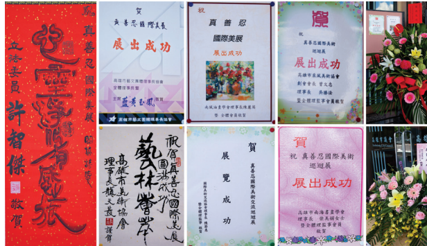
Triển lãm nhận được nhiều thư chúc mừng từ các chủ tịch hội đồng quản trị, các giám đốc, các chính trị gia và các quan chức địa phương

Nhiều ủy viên hội đồng, các nhà lập pháp, các chủ tịch hội đồng quản trị và các giám đốc hội nghệ thuật đã tham dự lễ khai mạc triển lãm vào ngày 02 tháng 06 ở Tòa Hội đồng. Triển lãm đã nhận được sự đánh giá cao về nội dung sâu sắc và tinh thần kiên cường được phản ánh trong các tác phẩm nghệ thuật tinh tế.