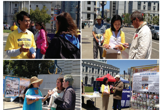
Người dân tìm hiểu về Pháp Luân Công và cuộc bức hại ở Trung Quốc