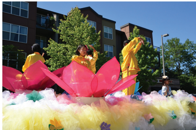
Các học viên biểu diễn năm bộ công pháp Pháp Luân Đại Pháp Bài viết của một học viên ở Bang Washington, Mỹ

Xuất phát từ Trung Quốc năm 1992, đến nay Pháp Luân Công đã có mặt trên khắp thế giới với học viên từ đủ mọi quốc gia, sắc tộc, cũng như các thành phần xã hội. Đối mặt với cuộc đàn áp tà ác của Đảng cộng sản Trung Quốc, học viên Pháp Luân Công càng thể hiện sức mạnh tinh thần hơn nữa qua việc phản bức hại bằng con đường nêu cao đạo lý Chân-Thiện-Nhẫn.