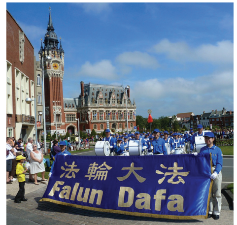
Thiên Quốc Nhạc Đoàn trong lễ diễu hành

Sau phần biểu diễn của họ, đoàn nhạc đã biểu diễn giống như đang tiến quân, dọc con đường đến Bassin Ouest trên bãi biển. Trong số những người đi theo sau có một cặp vợ chồng là khách du lịch đến từ Paris. Người chồng, là một nhạc công, đã nói với các học viên: "Các bạn có biết rằng các bạn là nhóm duy nhất được chủ tọa khen ngợi không? Ông ấy đã liên tục nói những điều tốt đẹp về các bạn. Các bạn đã làm rất tốt". Khi biết rằng có nhiều điểm luyện công ở Paris, họ đã bày tỏ mong muốn được học các bài công pháp. ◇