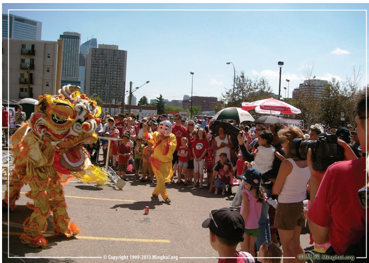
Khách tham quan thưởng thức màn múa sư tử do các học viên Pháp Luân Công biểu diễn

Bài viết của một học viên ở Calgary, Canada