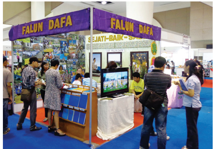
Các học viên tham gia Triển lãm Quốc tế Surabaya ở Indonesia

Cuộc triển lãm được tổ chức ở Tunjungan Plaza và có khoảng 100 công ty và các tổ chức tham gia. ◇