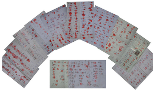
1.371 người dân ở tỉnh Hà Bắc đã ký vào đơn kiến nghị kêu gọi trả tự do cho học viên Pháp Luân Công, ông Lý Lan Khuê