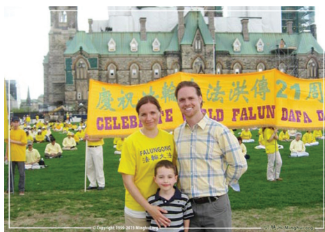
Drew, vợ và con trai của họ trước tòa nhà Quốc hội Parliament Hill ở Ottawa ngày 08 tháng 05 năm 2013