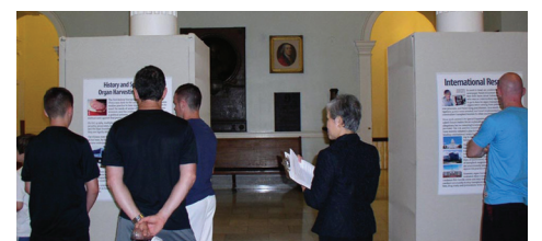
Khách tham quan đọc các tấm áp phích mô tả chi tiết hành động mô cướp nội tạng từ các học viên Pháp Luân Công còn sống của ĐCSTQ

[MINH HUỆ] Các áp phích mô tả tội ác mô cướp nội tạng từ các học viên Pháp Luân Công còn sống của Đảng Cộng sản Trung Quốc (ĐCSTQ) được trưng bày bên trong Tòa nhà chính phủ bang Massachusetts, ở Boston, vào ngày 24 đến ngày 28 tháng 06 năm 2013. Nhiều quan chức liên bang và khách tham quan đã dừng lại để đọc các tấm áp phích. Sau khi biết sự thật, họ đã lên án sự tàn bạo của chính quyền Trung Quốc, và kêu gọi chấm dứt tội ác chống lại nhân loại này. ◇