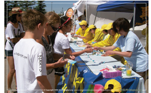
Gian hàng thông tin Pháp Luân Công

khoảng sáu tháng, và bây giờ sức khỏe của bà tốt hơn nhiều và bà lại có một cuộc sống bình thường. Các thành viên trong gia đình rất hạnh phúc khi thấy những thay đổi ở bà của chúng tôi. Họ đã chứng kiến huyền năng của Đại Pháp và bắt đầu đọc Chuyên Pháp Luân.