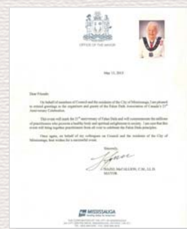
Lời chúc từ Văn phòng Thị trưởng, Thành phố Mississauga

[MINH HUỆ] Ngày 13 tháng 05 năm 2013 là Ngày Pháp Luân Đại Pháp Thế giới thường niên lần thứ 14 và đánh dấu 21 năm Pháp Luân Đại Pháp được giới thiệu ra công chúng bởi ông Lý Hồng Chí, người sáng lập Pháp Luân Đại Pháp. Nhân dịp đặc biệt này, nhiều quan chức chính phủ Canada đã gửi thư chúc mừng ghi nhận 21 năm Pháp Luân Đại Pháp được giới thiệu ra công chúng.