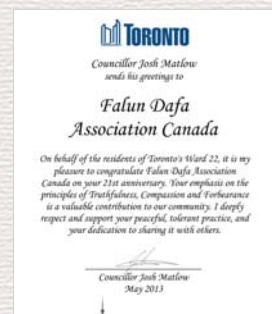
Lời chúc của Thành viên hội đồng Josh Matlow, Hội đồng thành phố Toronto