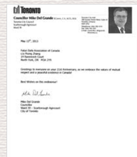
Lời chúc của Thành viên hội đồng Mike Del Grande, Hội đồng thành phố Toronto