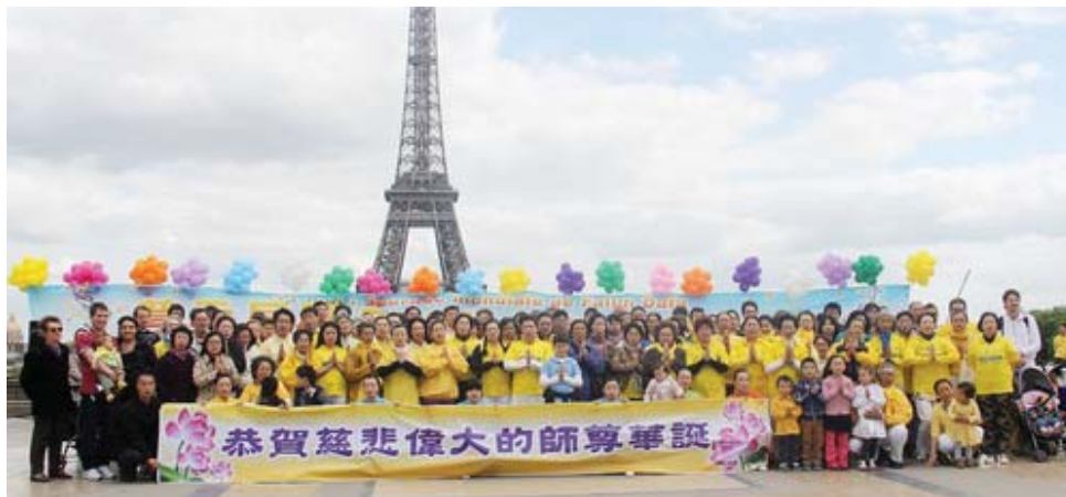
Các học viên Pháp Luân Công kính chúc Sư phụ sinh nhật vui vẻ

Bài viết của các học viên Pháp Luân Công ở Pháp