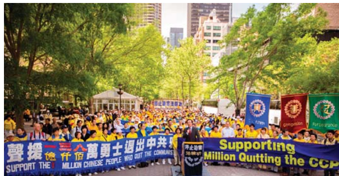
Mít tinh phía trước trụ sở của Liên Hợp Quốc phơi bày tội ác của ĐCSTQ và ủng hộ cho những người đã thoát xuất khỏi ĐCSTQ.