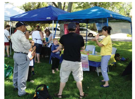
Học các bài công pháp Pháp Luân Công tại Lễ hội

[MINH HUỆ] Vào ngày thứ Bảy, ngày 04 tháng 05 năm 2013, các học viên Pháp Luân Đại Pháp tại khu vực Sacramento, California đã tham gia Lễ hội Gia đình và Cộng đồng “DỰ ÁN TÔI HẠNH PHÚC” tại công viên Royer, Roseville, California.