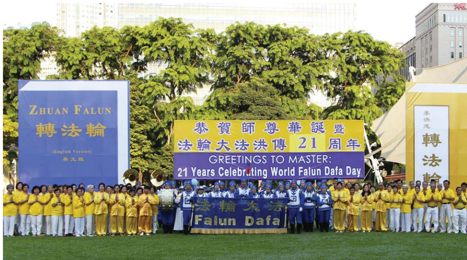
Các học viên ở Singapore kỷ niệm Ngày Pháp Luân Đại Pháp Thế giới lần thường niên thứ 14 và sinh nhật lần thứ 62 của ông Lý Hồng Chí

Các thành viên của Thiên Quốc Nhạc Đoàn Pháp Luân Đại Pháp trong trang phục triều đại nhà Đường đã biểu diễn các bản nhạc hùng tráng. Tiếng nhạc của họ tràn đầy năng lượng và truyền cảm hứng cho người nghe. Các học viên khác đã biểu diễn năm bộ công pháp Pháp Luân Công an hòa, và phân phát các tài liệu thông tin cũng như những bông sen giấy làm bằng tay tuyệt đẹp cho người qua đường. Họ cũng chia sẻ về những kinh nghiệm tu luyện Pháp Luân Công của mình.