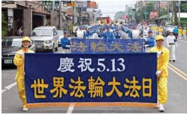
Các học viên ở Bình Đông, Đài Loan, diễu hành chào mừng Ngày Pháp Luân Đại Pháp Thế giới

[MINH HUỆ] Ngày 04 tháng 05 năm 2013, các học viên từ Bình Đông, phía Bắc Đài Loan, đã tổ chức một lễ đại diễu hành để kỷ niệm Ngày Pháp Luân Đại Pháp Thế giới sắp tới. Ngày 13 tháng 05 sẽ đánh dấu kỷ niệm 21 năm Pháp Luân Đại Pháp được phổ truyền, và cũng là ngày sinh nhật của Sư phụ Lý Hồng Chí, người sáng lập pháp môn.