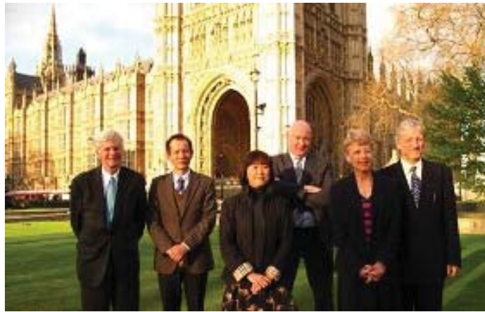
Năm diễn giả khách mời đặc biệt tại phiên điều trần “Hành động để chấm dứt nạn mổ cướp nội tạng sống”

[MINH HUỆ] Vào ngày 29 tháng 04 năm 2013, một phiên điều trần đặc biệt về mổ cướp nội tạng đã được tổ chức ở Quốc hội Vương quốc Anh. Hiệp hội Bác sĩ Chống Cường bức Mổ cướp Nội tạng (DAFOH) đã tổ chức phiên điều trần này để vạch trần tội ác mổ cướp nội tạng đang diễn ra ở Trung Quốc và để thảo luận về những nỗ lực của cộng đồng quốc tế trong việc triển khai các thủ tục pháp lý nhằm chống lại tội ác này. Các phát ngôn viên khuyến khích chính phủ Anh nên có những hành động giống như chính phủ các nước Úc, Mỹ và Israel trong việc áp dụng cách tiếp cận tích cực nhằm ngăn chặn tội ác vô nhân đạo này. Phiên điều trần có sự tham dự của các nghị sỹ từ tất cả các bên, các trợ lý chính trị và chiến lược, các đại diện chính phủ và các nhà hoạt động nhân quyền.