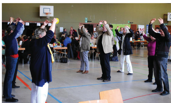
Nhiều người đã học các bài công pháp ngay tại chỗ trong một triển lãm sức khỏe ở Đức vào ngày 21 tháng 04

Các học viên đã biểu diễn lập đi lập lại các bài công pháp của Pháp Luân Công trên sân khấu, với biểu ngữ mang dòng chữ “Chân – Thiện – Nhân” hiện