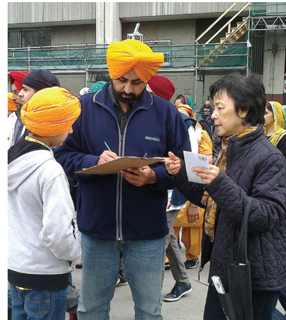
Nhiều người đã ký tên thỉnh nguyện nhằm kêu gọi chấm dứt cuộc đàn áp trước Tòa Thị chính Toronto vào ngày 26 tháng 04

Sau khi biết về cuộc đàn áp, một nhân viên xã hội đã nhiều lần hỏi các học viên Pháp Luân Công: “Tôi có thể làm gì để giúp các bạn?” Ông đã ký tên thỉnh nguyện và xin năm tờ đơn [thỉnh nguyện] trống để đi thu thập chữ ký từ bạn bè của mình. Nửa giờ sau, ông trở lại với 40 chữ ký. Ông lại xin thêm một đơn thỉnh nguyện mới để có thể thu thập chữ ký từ gia đình và bạn bè. Ông cũng đã để lại thông tin liên lạc của mình cho các học viên Pháp Luân Công.