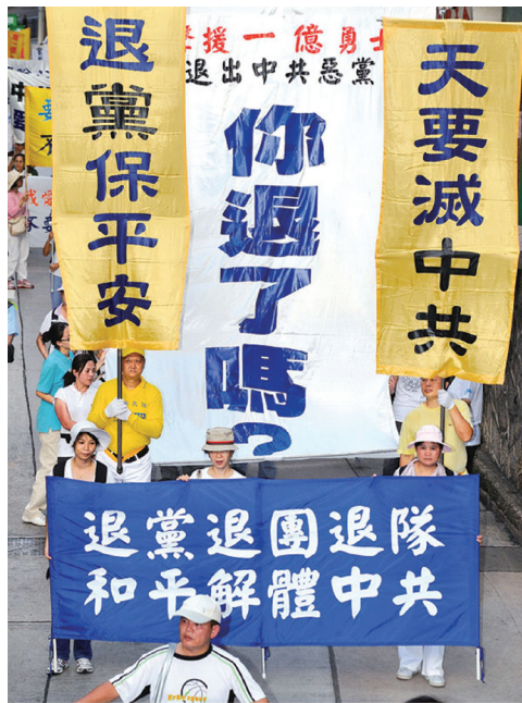
“Thoái Đảng” trở thành ưu tiên hàng đầu cho người Trung Quốc đại lục

Khi người đàn ông chăm chú lắng nghe, bà Vương nói: “Ông làm việc trong hệ thống và ông biết ĐCSTQ tà ác thế nào. Trời sẽ không tha cho nó đâu. Bây giờ con người đang thức tỉnh và bắt đầu phản đối cuộc bức hại. Từ hàng chục ngàn chữ ký và dấu vân tay để ủng hộ các học viên Pháp Luân Công cho đến những cuộc kháng nghị quy mô lớn thường xuyên để bảo vệ quyền của họ, rõ ràng là một sự thay đổi lịch sử to lớn đang sắp diễn ra.”