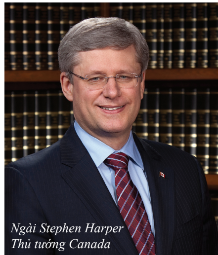
Ngài Stephen Harper Thủ tướng Canada

[MINH HUỆ] NGÀY 13 THÁNG 05 NĂM 2013 ĐÁNH DẤU 21 NĂM NGÀY PHÁP LUÂN ĐẠI PHÁP ĐƯỢC ÔNG LÝ HỒNG CHÍ – NGƯỜI SÁNG LẬP RA PHÁP LUÂN ĐẠI PHÁP, PHỔ TRUYỀN RA CÔNG CHÚNG.