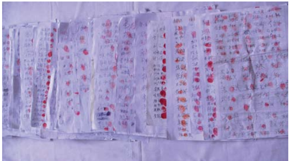
15.000 người dân ở Y Xuân, tỉnh Hắc Long Giang đã ủng hộ cô Tần Vinh Thiên [bằng việc] ký tên và in vân tay lên lá thư kiến nghị, đòi công lý cho cái chết của cha cô