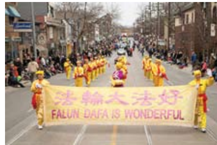
Đội trống lung đặc trưng cho nền văn hóa truyền thống của Trung Quốc

Năm nay, các học viên Pháp Luân Công đã trình diện hai nhóm nhạc thú vị – Thiên Quốc Nhạc Đoàn và đội trống lung truyền thống. Thiên Quốc Nhạc Đoàn đã tham gia lễ diễu hành sáu lần liên tiếp. Đây cũng là lần thứ hai đội trống lung Pháp Luân Công tham gia cuộc diễu hành Lễ Phục Sinh.