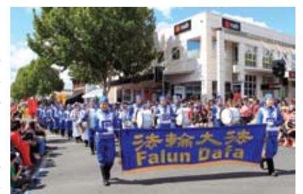
Thiên Quốc Nhạc Đoàn