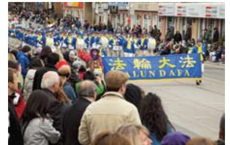
Thiên Quốc Nhạc Đoàn là đoàn lớn nhất tại cuộc diễu hành