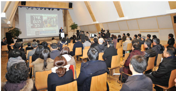
Buổi phát hành sách Tặng Nhà nước phiên bản Hàn Quốc tại Trung tâm Công giáo Tuổi trẻ ở Seoul, Hàn Quốc

Ông đã thúc đẩy việc cấm buôn bán nội tạng quốc tế, hạn chế việc cấy ghép nội tạng sống ở hải ngoại, kiểm soát nghiêm ngặt những nội tạng lưu thông qua các biên giới, và yêu cầu các công ty bảo hiểm ngừng chi trả cho những ca cấy ghép nội tạng bất hợp pháp. ◇