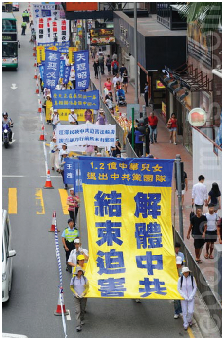
Các biểu ngữ trong một cuộc diễu hành kỷ niệm việc hơn 135 triệu người Trung Quốc trên toàn thế giới đã thoái ĐCSTQ và các tổ chức liên đới của nó (Hình ảnh đăng trên Thời báo Đại Kỷ Nguyên)

Bà Vương rất xúc động bởi những gì đã xảy ra: “Nhờ những nỗ lực giảng chân tướng không mệt mỏi của các học viên Pháp Luân Công trong suốt những năm qua, người dân đã tỉnh thức. Các viên chức của ĐCSTQ đang chủ động gọi điện để thoái khỏi ĐCSTQ.”