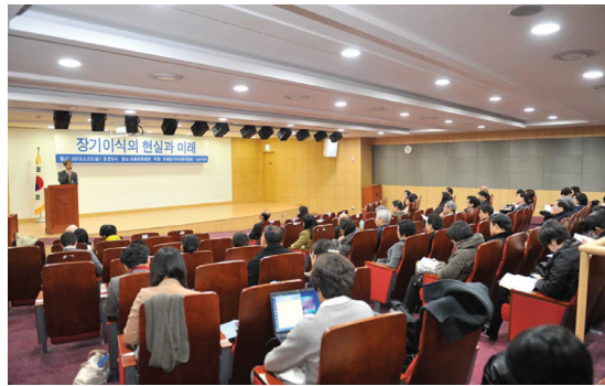
Các chuyên gia đã tổ chức một hội nghị ở tòa nhà Quốc Hội nhằm nghiên cứu những giải pháp chấm dứt tội ác mồ cướp nội tạng

Nhật báo Joogang Hàn Quốc, Dong-A Ilbo (Nhật báo Đông Á) và các hãng truyền thông chủ lưu ở Hàn Quốc khác đã đưa tin về những sự kiện này.