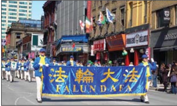
Thiên Quốc Nhạc Đoàn của Pháp Luân Đại Pháp tham gia Lễ diễu hành Ngày Thánh Patrick lần thứ bảy liên tiếp