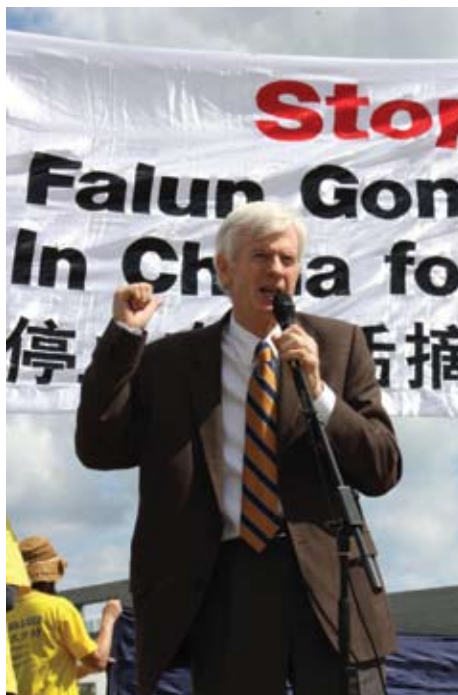
Ông David Kilgour, nguyên Quốc vụ khanh, Nghị sỹ Quốc hội và nhà hoạt động nhân quyền của Canada tham gia buổi mít tinh