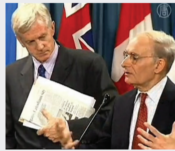
Ông David Kilgour và luật sư David Matas