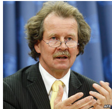
Ông Manfred Nowak

Những báo cáo từ các nhân chứng và các bác sỹ Trung Quốc đã tiết lộ rằng, hàng nghìn học viên Pháp Luân Công đã bị mổ cướp tạng trong khi vẫn còn sống. Thủ phạm chính là các viên chức của ĐCSTQ, họ thông đồng với các bác sỹ phẫu thuật, những người quản lý trại giam, và các quan chức quân đội để lấy tạng của các học viên bán và phục vụ cho việc cấy ghép siêu lợi nhuận.